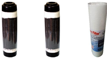
Ferrolite Manganese Greensand Cartridge Sediment 10"